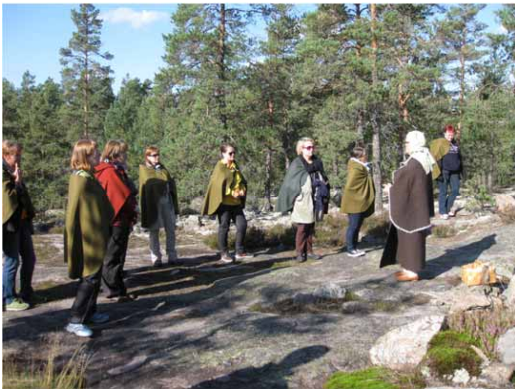
Kulttuurituotannon ja maisemantutkimuksen koulutusohjelma Satakunnan ympäristökoulu